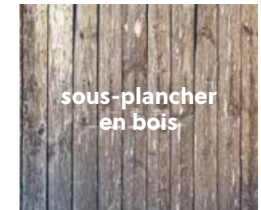
sous-plancher en bois

SPIRIT GlueDown peut être installé uniquement sur un sous-plancher parfaitement nivelé car tout écart entre le carrelage peut se voir ultérieurement au travers du nouveau revêtement. Il n'est pas recommandé de réaliser une pose directement sur du carrelage non nivelé !