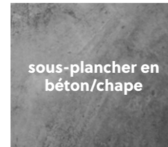
sous-plancher en béton/chape

Préparation spécifique selon le type de sous-plancher :