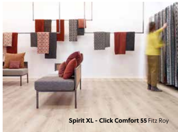
Spirit XL - Click Comfort 55 Fitz Roy

Het plaatsen van de vloer moet altijd de laatste stap zijn van het project om te voorkomen dat andere werken de vloer beschadigen. Gebruik voor een optimaal resultaat steeds de speciale en aanbevolen accessoires van BerryAlloc. Zo voorkom je bovendien dat de garantie vervalst. Accessoires van buitenlandse leveranciers bieden mogelijk niet dezelfde kwaliteit en/of functionaliteit.