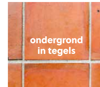
ondergrond in tegels

Laat nieuw beton voldoende uitdrogen. Het vochtgehalte van de ondergrond moet lager zijn dan 75% RH bij min. 20 °C. Max. 2 CM% voor cement en 0,5CM% voor anhydriet. Bij vloerverwarming moet het vochtgehalte lager zijn dan 1,8 CM% voor cement en 0,3 CM% voor anhydriet. Noteer steeds de resultaten van je vochtmetingen en houd ze bij.