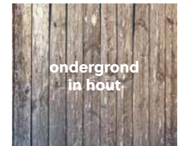
ondergrond in hout

Controleer de ondergrond op vochtproblemen. Laat de voegen nooit samenvallen met de voegen van de onderliggende tegelvloer. Als de voegen van de onderliggende keramische tegelvloer niet breder zijn dan 5 mm, hoef je ze niet op te vullen. Houd er rekening mee dat sommige keramische tegels opgaande randen/hoeken kunnen hebben, terwijl de rest van de tegel vlak kan zijn. Deze uitstekende delen kunnen zichtbaar worden doorheen de toekomstige vloerbekleding.