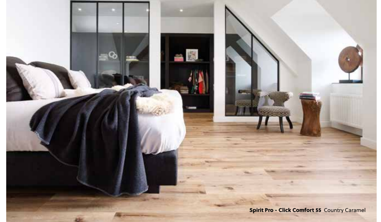
Spirit Pro - Click Comfort 55 Country Caramel